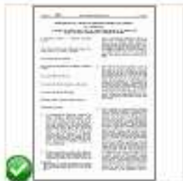
Reg 1305 - Sviluppo Rurale