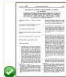
Reg 1310 - Atti transitori