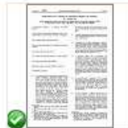
Reg 1308 - Ocm