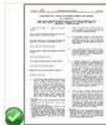
Reg 1307 - Pagamenti diretti