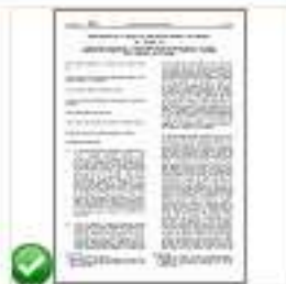
Reg 1306 - Misure orizzontali