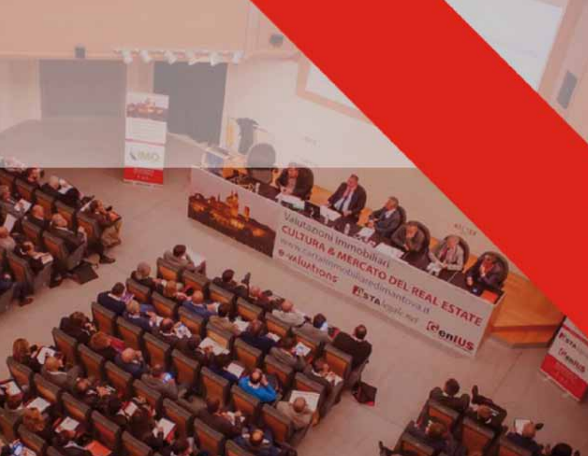
◀ E-Valuations Istituto di Estimo e Valutazioni.

Associazione dal titolo “LA CONSULENZA TECNICA D’UFFICIO NEL PROCESSO - profili tecnici e giuridici, tra prassi e regole di procedura”.