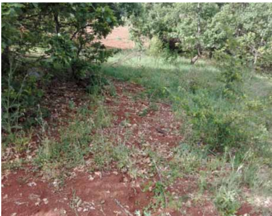
◀ Figura 3 - Tartufaia naturale con presenza del "pianello" in agro di Marsico Nuovo (PZ).

Tenendo presente quanto descritto, e a seguito di esperienze di campo, si ritiene che lo sviluppo della tartuficoltura in Basilicata sia perseguibile offrendo un'alternativa valida di incremento al reddito con prospettive di sviluppo tali da portare questa regione a competere, sia dal punto di vista qualitativo che quantitativo, con il resto del contesto italiano. ■