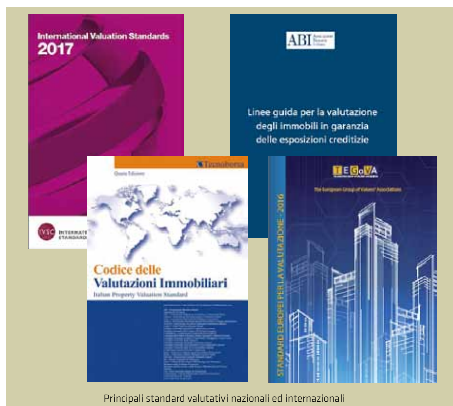
Principali standard valutativi nazionali ed internazionali

damentali per una valutazione corretta degli immobili, un impegno condiviso anche dai Consigli nazionali delle professioni tecniche che hanno assunto la responsabilità di orientare il cambiamento anche da un punto di vista culturale, erogando ai propri iscritti percorsi formativi di qualità, a tutela del consumatore, della trasparenza del mercato e della professionalità degli operatori. ■