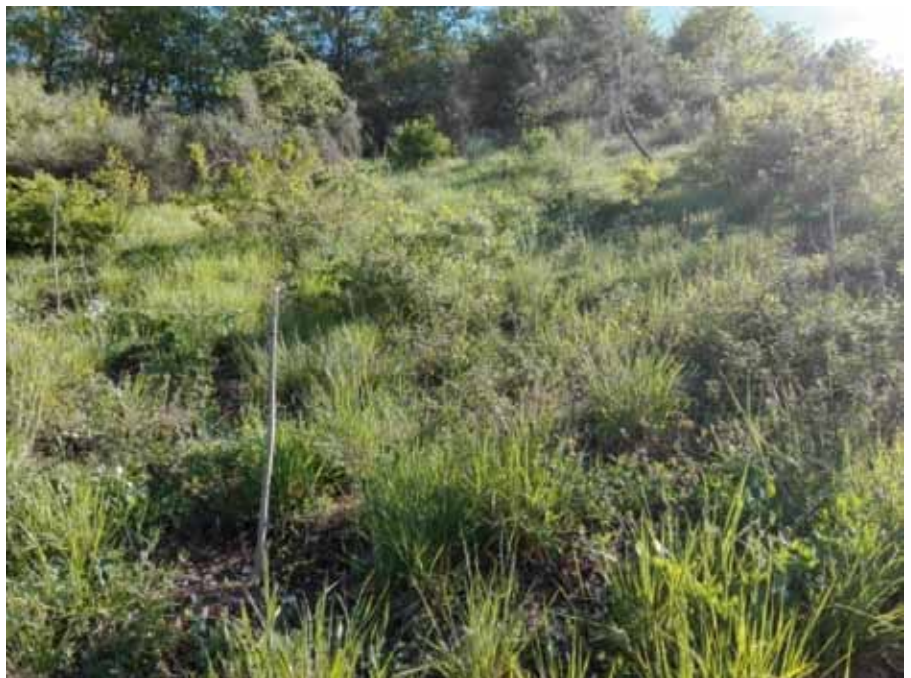
▲ Figura 2 - Impianto a buche in un ceduo degradato di Pergola di Marsico Nuovo (PZ), si notano i pali tutori.

I terreni abbandonati vanno gestiti in modo diverso a seconda della vegetazione che li ha ricoperti: terreni con rovi ed erbacce si prestano ad essere ripuliti su tutta la superficie; in macchieti o boschi si potrebbe pensare, invece, ad un arricchimento delle specie presenti con piante micorrizzate. La preparazione del terreno consiste in un'aratura superficiale 30-35 cm o nella creazione di buche atte ad